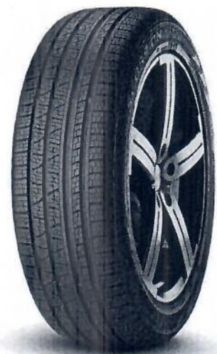
Pneu Pirelli Aro 16 215/65r16 102h XI S-veas Scorpion Verde