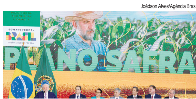
O presidente Lula participa da Cerimônia no Palácio do Planalto do lançamento do Plano Safra 2023/2024

Para Lula, o setor produtivo não pode ser "predador" das riquezas naturais do país, que são um bem para as futuras gerações. "Nós não precisamos desmatar nada para criar mais gado, para plantar mais soja, nós temos possibilidade de re-