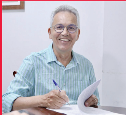
O PREFEITO MARCOS SANTANA