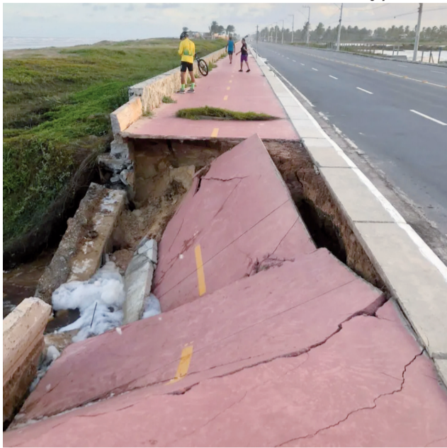
A Defesa Civil interditou a o trecho da ciclovia e não há prazo previsto para recuperação

"Infelizmente, a região ainda não tem a rede de drenagem, mas será solucionada no futuro com a abertura de um canal com a nova rodovia, que está sendo objeto de empreendimento para que essa obra possa ser iniciada o mais rápido possível. O que ocorreu ontem foi que numa dessas aberturas do extravasador na ten-