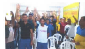
Correios em Sergipe deflagram greve a partir desta segunda-feira (19).

Ainda segundo a categoria, a proposta apresentada pelos Correios incluía um reajuste salarial somente para janeiro de 2025, ignorando a data-base da categoria, que é em agosto. Além disso, o reajuste proposto seria exclusivo para as funções motorizadas, como carteiros que utilizam veículos, deixando de fora outras funções essenciais, como os Operadores de Equipamento de Segurança Postal (OESP). A falta de valorização de toda a categoria foi um dos principais pontos de insatisfação.