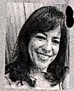
Psicóloga e Consultora Organizacional