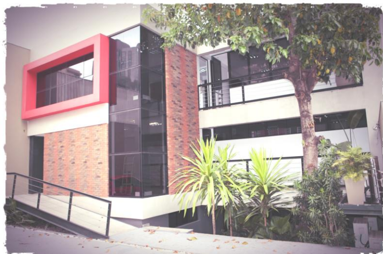
Sede São Paulo/SP (Prédio 2)

O Instituto QUADRIX possui a infraestrutura necessária para a realização de todos os tipos de seleções em suas diversas fases, simultaneamente em diversas cidades e regiões. Com estrutura física própria, tendo em Brasília/DF sua base comercial e em São Paulo/SP a base operacional, com mais de 2.000 metros quadrados, totalmente voltada para a otimização de seus processos, sem a necessidade de terceirização de nenhuma etapa dos serviços. Além das sedes em Brasília/DF e São Paulo/SP, o Instituto QUADRIX possui abrangência nacional, com representações/bases logísticas em todas as capitais e também em cidades que são polos regionais.