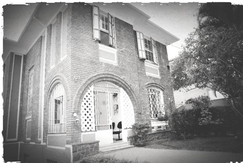
Sede São Paulo/SP (Prédio 1)

Este data center conta com redundância de fornecimento de energia elétrica e diferentes links de acesso à Internet, bem como nobreaks e geradores para fornecimento de energia crítica (2N Utility, 2N UPS, N+1 2MW Backup).