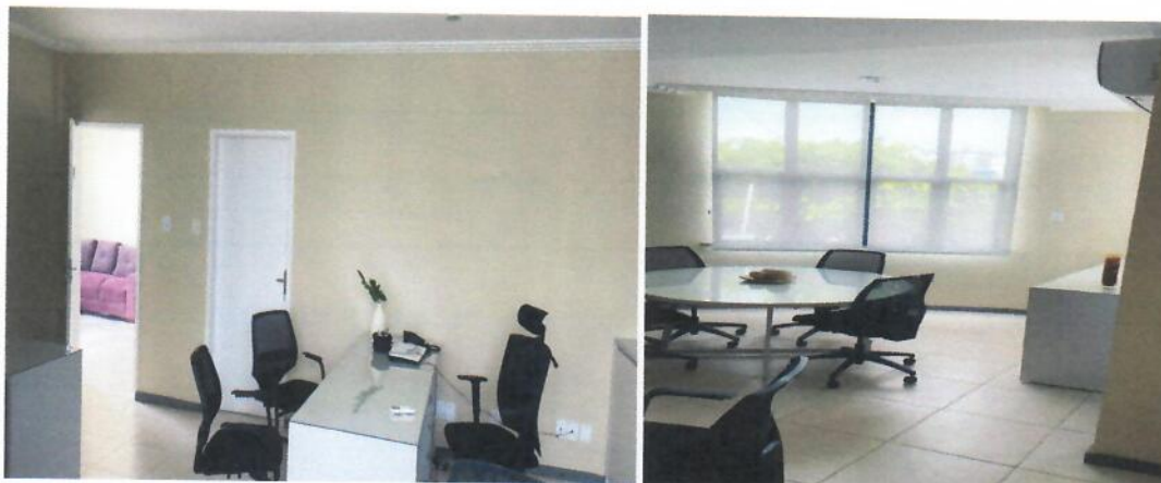
Item 02.013 – Ficha 13 - Corredor

Serviços de emassamento e pintura das paredes.