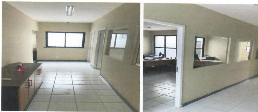
Item 02.014 – Ficha 14 – Fiscalização

Serviços de emassamento e pintura das paredes.